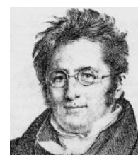
Fig. 1: Portrait d'Augustin-Pyramus de Candolle.

Key-words: de Candolle, Augustin-Pyramus, 19 th century, botany, history and philosophy of sciences.