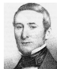
Fig. 3: Portrait d'Alphonse de Candolle, fils d'Augustin-Pyramus (collection privée, Genève).