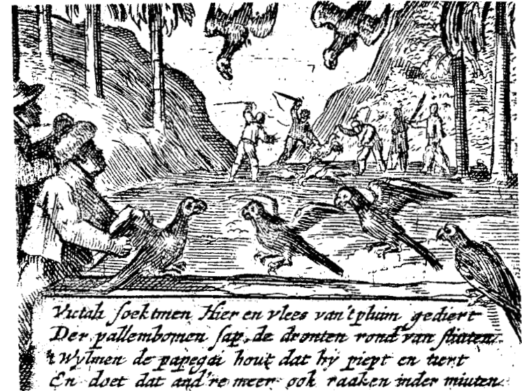
Capture de perroquets et massacre de dodos en arrière-plan. In: Van West-Zanen, Willem. Journal . Amsterdam, 1648