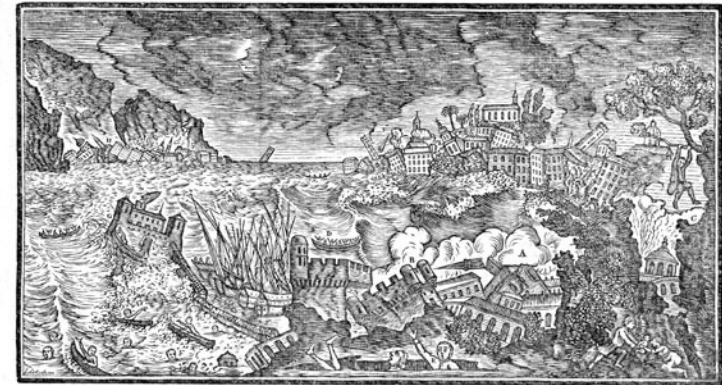
A. La ville de Messine en Sicile. B. Partie de la Citadelle s'écroulant dans la mer. C. La terre s'ouvre sous les pieds d'un homme qui s'accroche à un arbre. D. Les habitants qu'on a jetés devant les bouques. E. Gens ensevelis dans la terre. F. D'autres engloutis par la mer. G. Le Fatal du port renversé. H. La ville de Reggio en Calabre.

Terrible catastrophe en Sicile & Calabre par le tremblement de terre du 5. Fev. 1783.