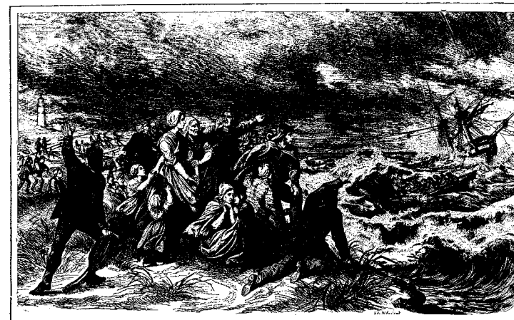
Sauvetage de naufragés par le moyen de fusées et de bateaux de sauvetage. In: Le véritable messager boiteux de Berne et Vevey , 1868