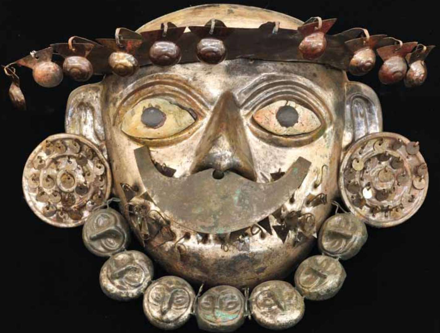
fig. 32: masque funéraire posé directement sur un second masque qui couvrait le visage du Seigneur de Ucupe. Cuivre argenté avec des incrustations de coquillages et de résine noire.