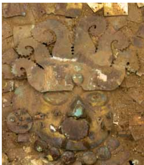
fig. 12 (page opposée): diadème en forme de V en cuivre doré avant et après restauration.