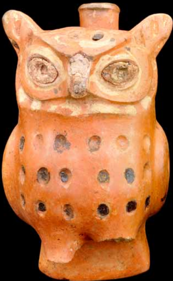
fig. 27 (ci-dessous): paire de vases en forme de hibou qui se situait avec l'une des deux accompagnatrices du Seigneur de Ucupe.

fig. 26 (page opposée): deux figurines hautes de 5 cm, représentant des êtres à crocs tenant dans la main droite un couteau sacrificiel et dans la gauche, une tête humaine. Cuivre doré.