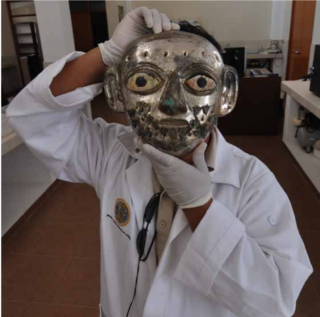
L'un des restaurateurs de la collection du Seigneur de Ucupe, musée Tumbas Reales de Sipán, Lambayeque.