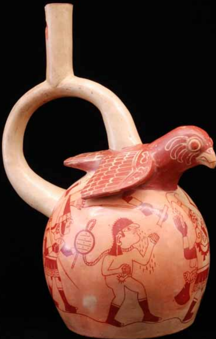
fig. 19 (ci-contre): céramique représentant une scène de capture de victimes sacrificielles. Musée de Tous-les-Saints, Schaffhouse.