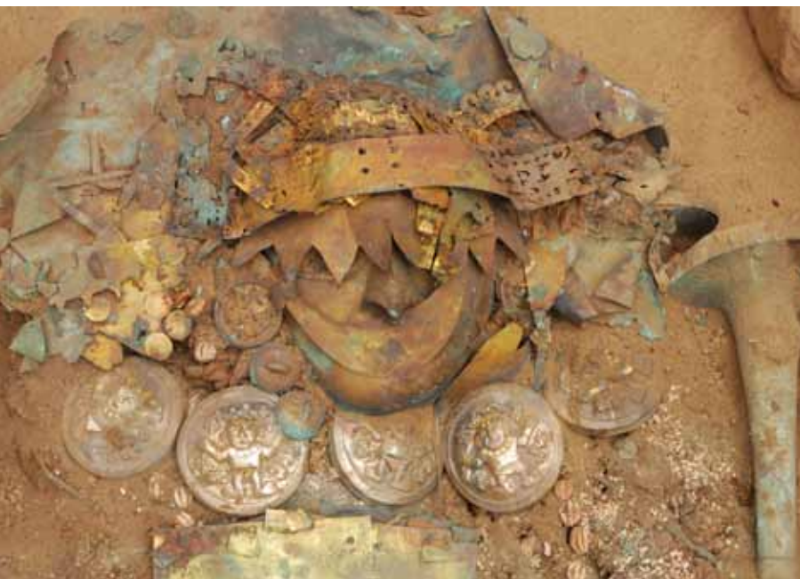
fig. 30 (ci-dessus): site sacrificiel, Place 3A, Huaca de la Luna, vallée de Moché.

C'est ainsi la première fois que l'agencement de deux masques sur le visage d'une dépouille mochica est observé lors de fouilles. Il semblerait que ces masques tous ensemble personnifiaient le défunt dirigeant arborant différents couvre-chefs.