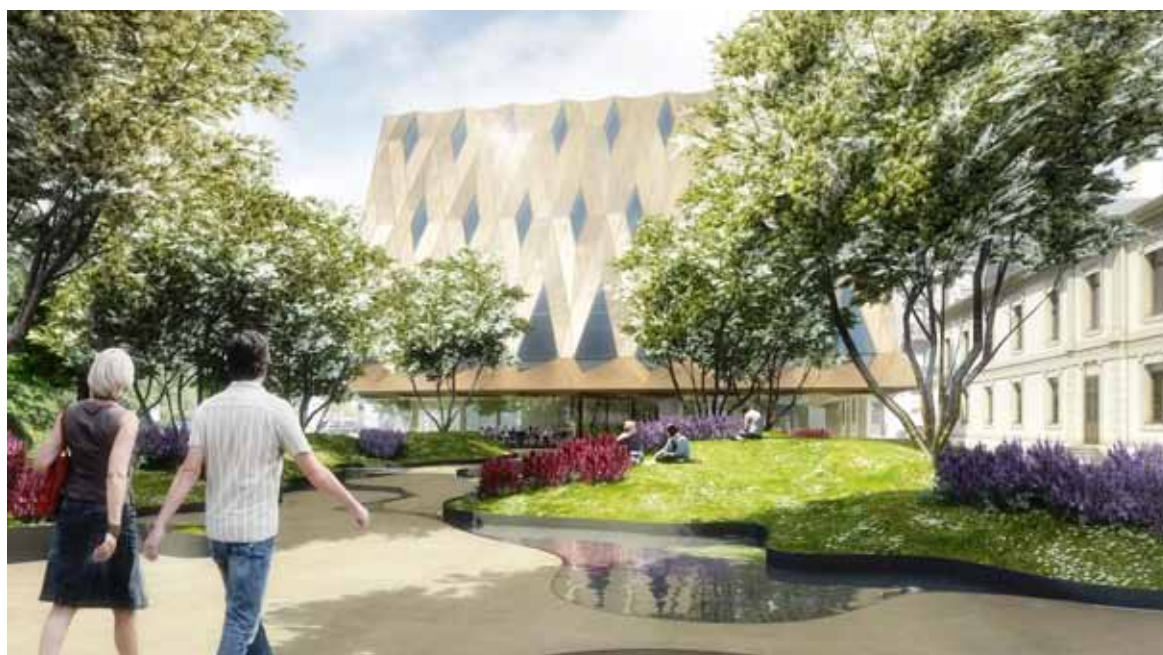
fig. 2: vue virtuelle du nouveau |ME|G|.

Pour la première fois, le |ME|G| recherche des partenaires privés pour l'accompagner dans ce projet qui est sans doute le plus ambitieux de son histoire. Le commissaire de l'exposition et moi-même sommes à votre écoute pour discuter de toute forme de collaboration.