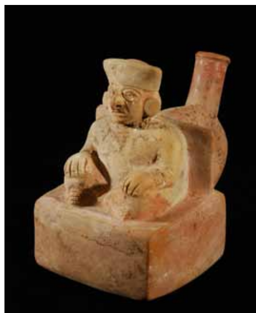
Céramique en forme de dirigeant assis sur un trône. Tombe du Seigneur de Ucupe.