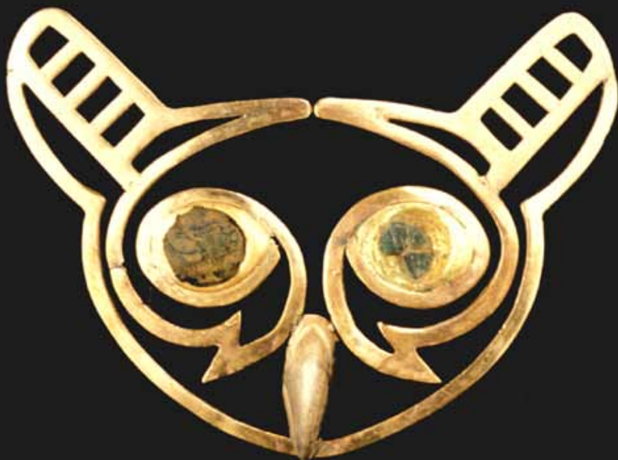
fig. 8: ornement nasal en or représentant une tête de hibou.

Les origines, l'histoire et la nature même des institutions politiques et religieuses de cette société sans écriture, demeurent au cœur de vifs débats. Ces trois dernières décennies, de nombreux sites mochica ont fait l'objet d'importantes prospections archéologiques. Du sable des vallées de la côte péruvienne ont alors surgi des complexes cérémoniels monumentaux, des mausolées funéraires abritant des tombes d'une richesse insoupçonnée, environnés de vastes aires domestiques. Les résultats de ces recherches scientifiques à grande échelle permettent d'envisager désormais certaines dimensions historiques de la culture mochica et d'étudier l'évolution de ses composantes économiques, sociales et politiques. Aujourd'hui, le mode de vie inhérent à cette société est plus tangible, tout comme le fonctionnement de ses institutions, la nature de ses élites et de leurs regalia.