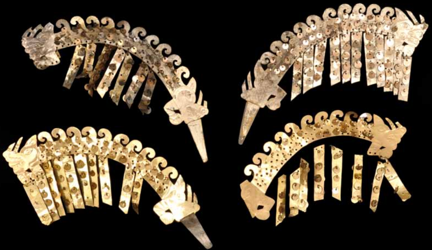
fig. 5: groupe de plumes métalliques appartenant à une couronne. Chacune d'entre elles représente une arche bicéphale à têtes de renard surmontée de tentacules de poulpe et ornée de pendentifs qui rappelle la forme de l'aile du hibou.