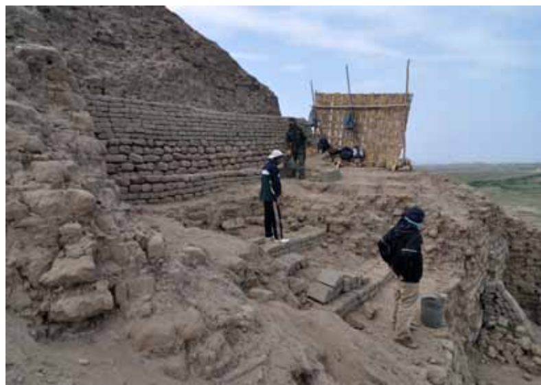
fig. 34: protection des murs peints de Huaca Dos Cabezas. Vallée de Jequetepeque.

En mars 2010, nous avons appris que le site de Dos Cabezas dans la vallée de Jequetepeque était soumis à des actes de vandalisme (fig. 34). Profitant de la nuit et du manque de protection de la zone, un groupe organisé d'une dizaine de pilleurs s'affairait, semble-t-il, à démanteler le flanc sud-ouest du temple principal. Ils étaient vraisemblablement à la recherche de tombes riches en artefacts. Puisque le site, l'un des plus importants de cette culture, fait partie des projets actuellement élaborés par le Centre de recherche en anthropologie du |ME|G| (CRA), nous avons décidé, en étroite collaboration avec les autorités péruviennes, de stopper ce pillage et d'ensevelir à nouveau les aires découvertes par les déprédateurs. L'opération principale fut de protéger par un pan de mur les frises peintes qui avaient été mises au jour sur le flanc du temple. Afin d'empêcher d'autres saccages éventuels du site, un gardien a été engagé. Tout au long de l'année 2010 et jusqu'à la prochaine saison de fouilles en mai 2011, ce dernier effectue des rondes d'inspection quotidiennes et maintient le contact avec notre groupe de recherche et les autorités locales.