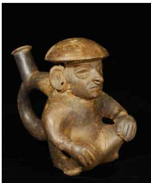
Céramique en forme de personnage assis, les jambes croisées. Tombe du Seigneur de Ucupe.