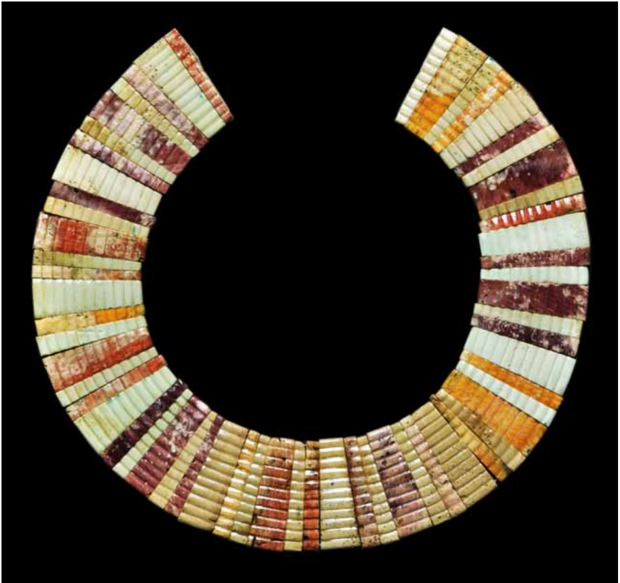
fig. 34: large pectoral composé de 60 plaques ouvragées de coquilles de spondyles et de cônes.