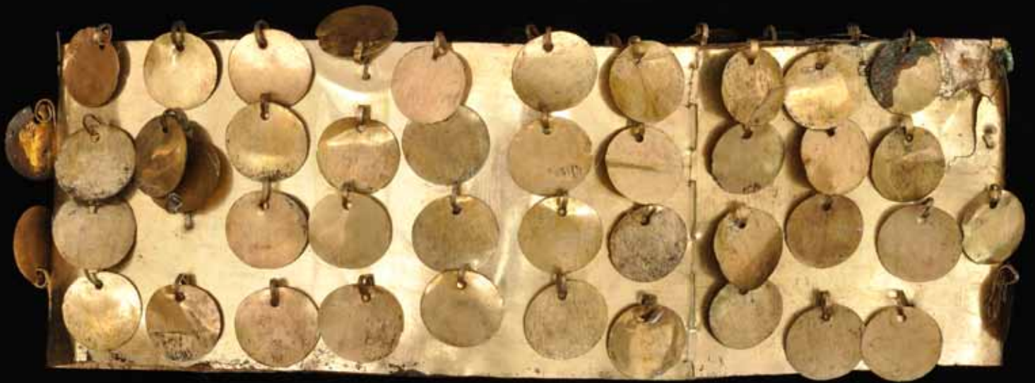
fig. 6: couronne ornée de 92 petits disques métalliques. Cuivre doré.