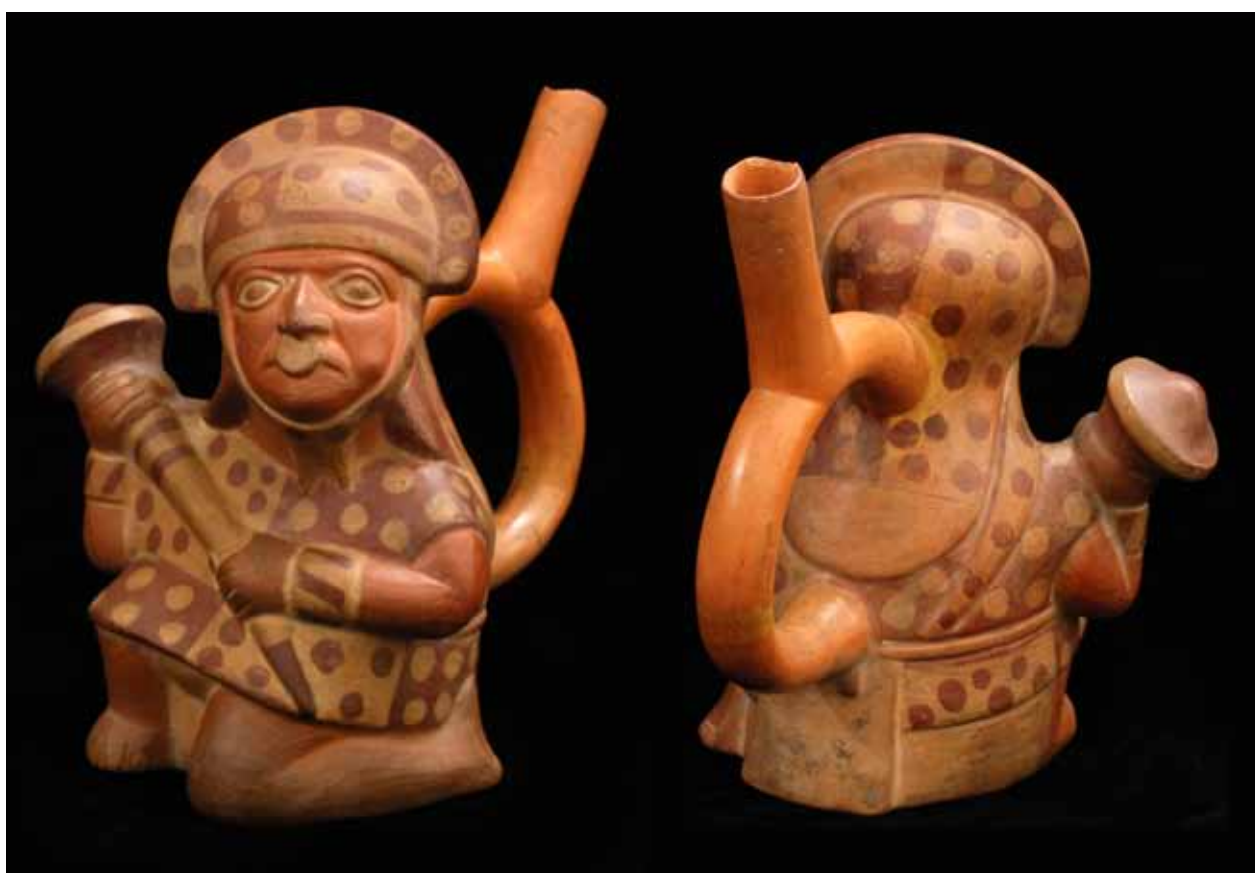
fig. 25 (ci-dessous): céramique représentant un guerrier mochica. |ME|G| Inv. ETHAM 053454.