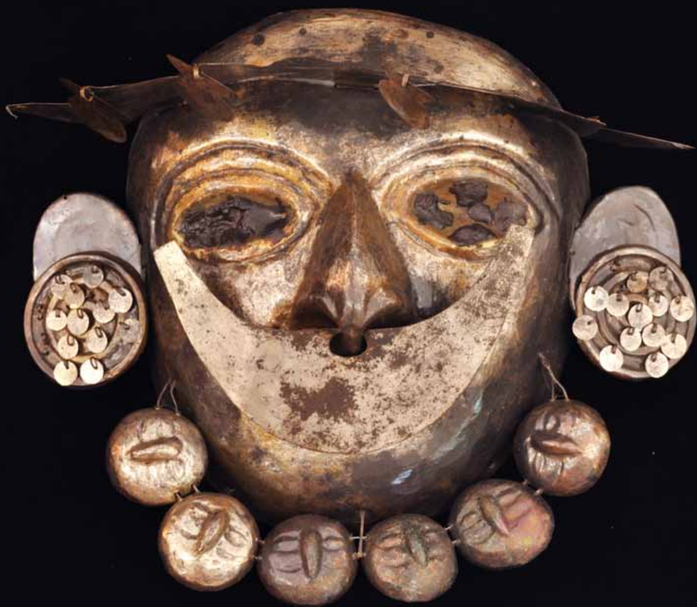
fig. 33: masque funéraire posé directement sur le visage du Seigneur de Ucupe. Cuivre argenté.