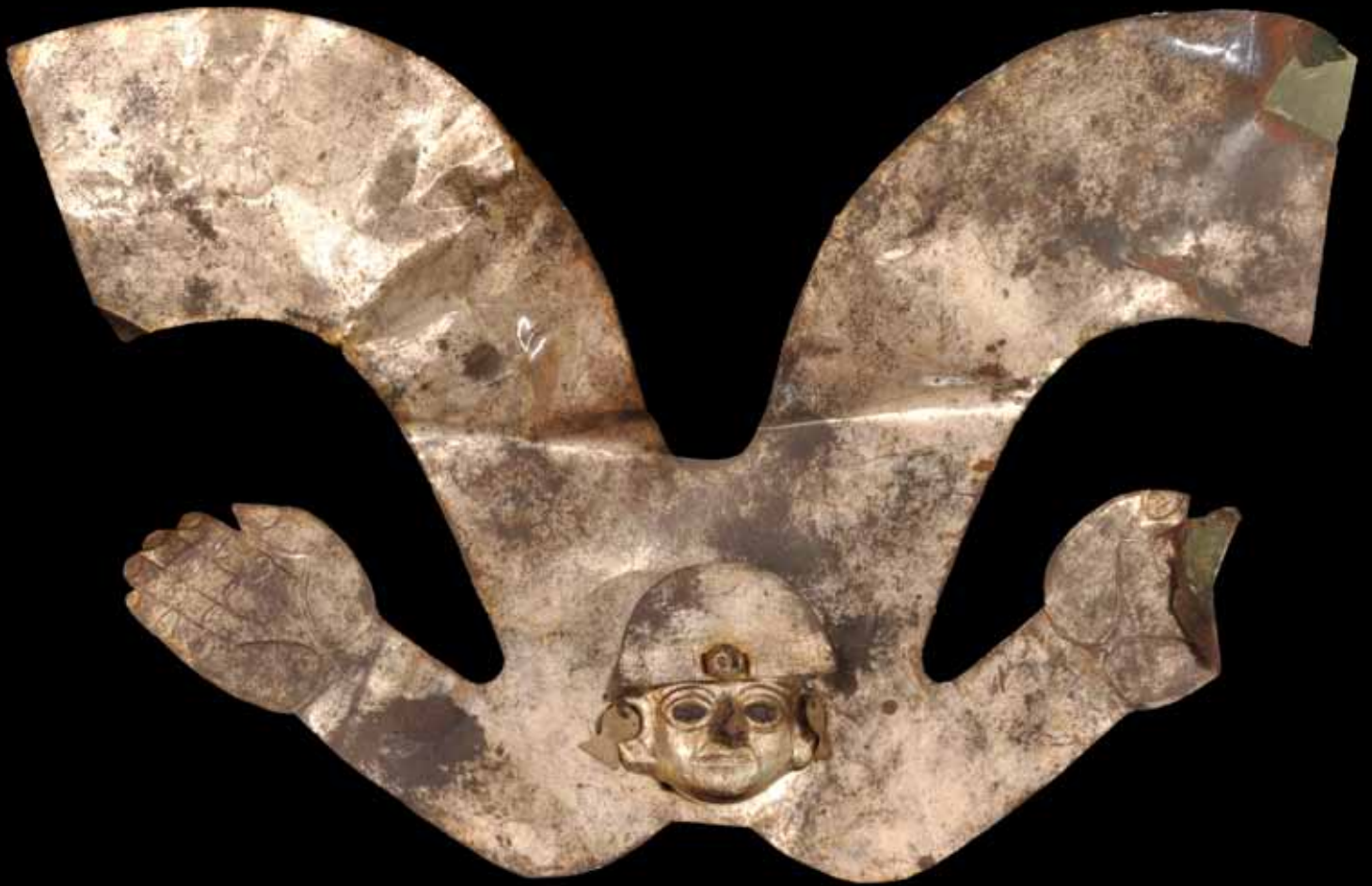
fig. 14: diadème en forme de V orné de bras humains et de la tête du dirigeant. Cuivre argenté.