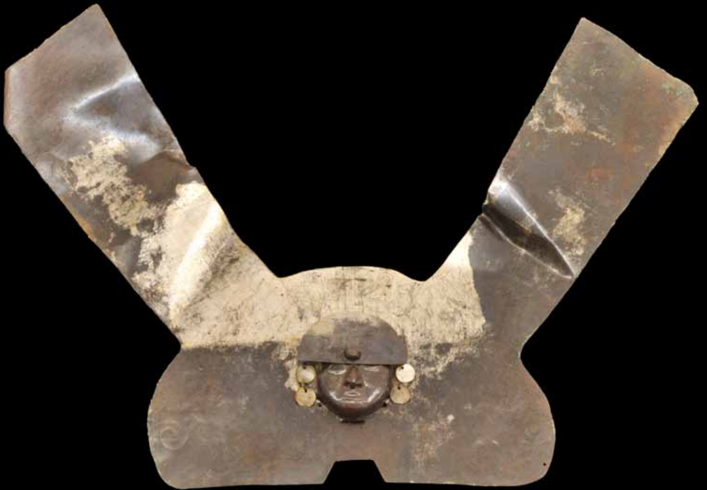
fig. 13: large diadème en forme de V au centre duquel est représenté la tête du dirigeant mochica. Cuivre doré.