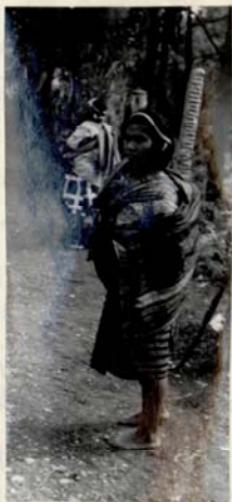
un pièce n° 31829