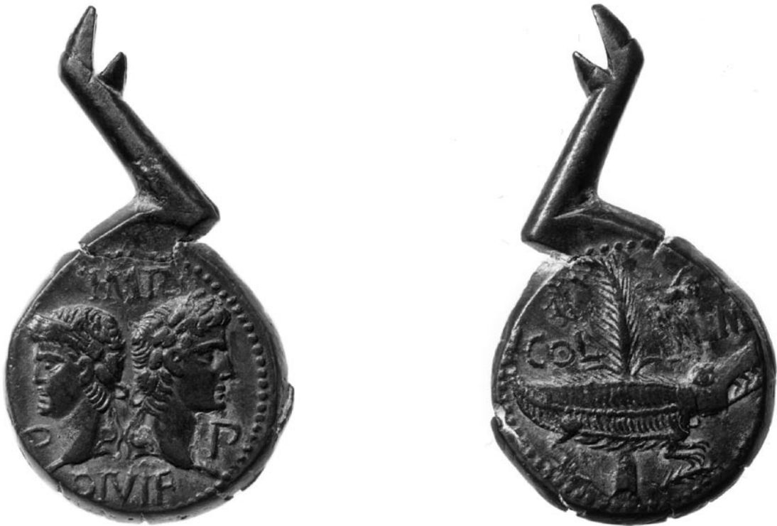
Fig. 4: Médaille de Nîmes dite «à la patte de sanglier», présentant une variante plus précise de l'appendice. (Inv. 73 A 25 1999). Diam. 2,8 cm.