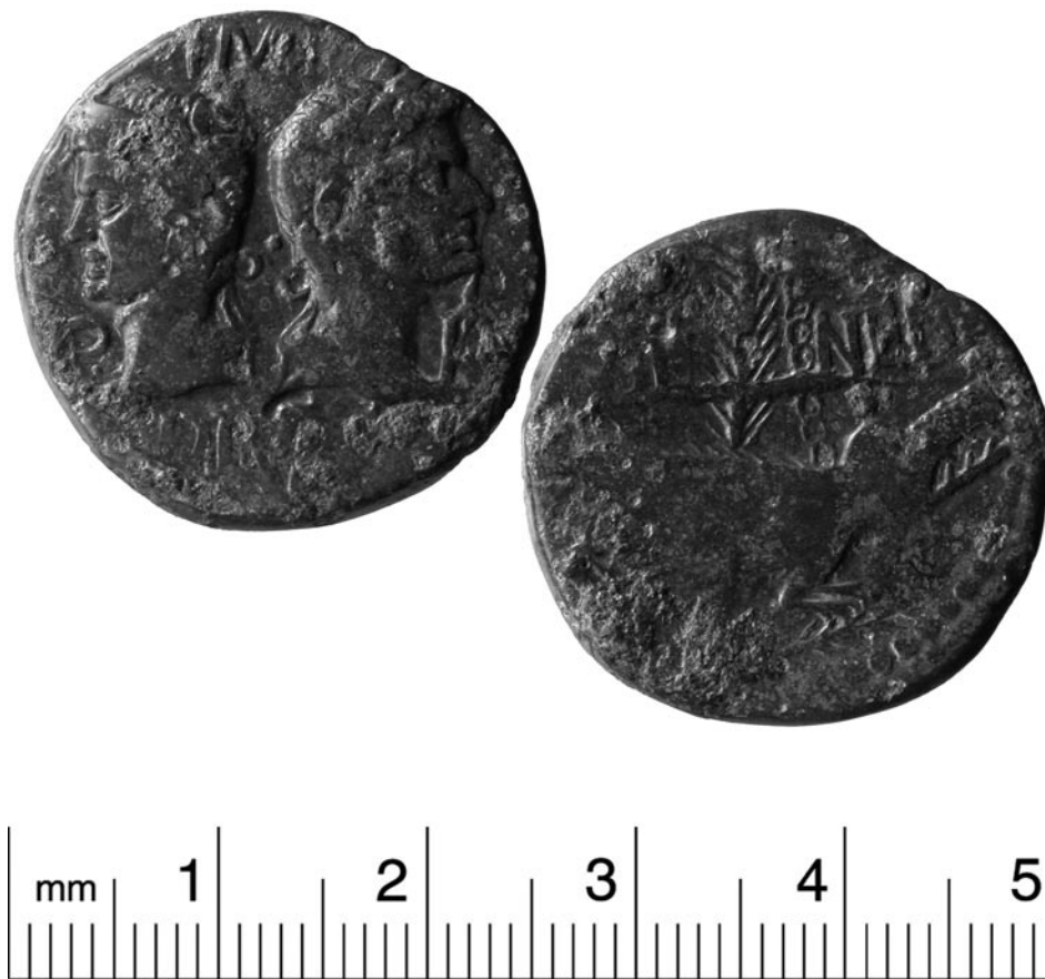
Fig. 2: Dupondius frappé à Nîmes, trouvé à Genève (MAH inv.). La scène du crocodile enchaîné à une palme évoque la victoire navale romaine d'Actium et la soumission de l'Égypte (Photographie du Musée d'Art et d'Histoire de Genève).

tament (EZECHIEL : 29, 3 : « ... j'en veux à toi, Pharaon, roi d'Égypte, grand crocodile qui te tiens couché au milieu de tes fleuves... je te mettrai des crochets aux mâchoires... »), figure à ce titre sur certaines monnaies romaines ; seul dans le champ, il orne ainsi le revers d' aurei portant la légende ÆGYPTO CAPTA , frappés en 27 av. J.-C., peu avant qu'OCTAVE, sous son 7 e consulat, reçoive le titre d'AUGUSTE par le Sénat (MATTINGLY & SYDENHAM, 1923 : 21). Parmi les faveurs insignes octroyées à la colonie de Nîmes par AUGUSTE, (les motifs d'un telle générosité prêtent toujours à discussion : VEYRAC, 1998 : 50-62), figure le privilège de frapper, probablement entre 18 av. J.-C. et 14-15 de notre ère, des dupondii à l'effigie du crocodile (Fig. 2). Constituant trois séries, ces pièces au service de la propagande impériale, ont circulé en grand nombre dans l'Empire, particulièrement en Occident. L'avers présente les bustes adossés d'AUGUSTE et d'AGRIPPA, avec la titulature IMP(erator) DIVI F(ilius) , conférée par le Sénat à OCTAVE en 27 av. J.-C., et, sur certaines séries, le titre P(ater) P(atriae) , accordé à AUGUSTE en 2 av. J.-C. ; le revers figure un crocodile, l'Égypte, la queue dressée, enchaîné à une palme couronnée, symbole de la victoire, accompagné de la légende COL(onia) NEM(ausus) . Ce monnayage, qui célèbre la victoire navale d'Actium (le