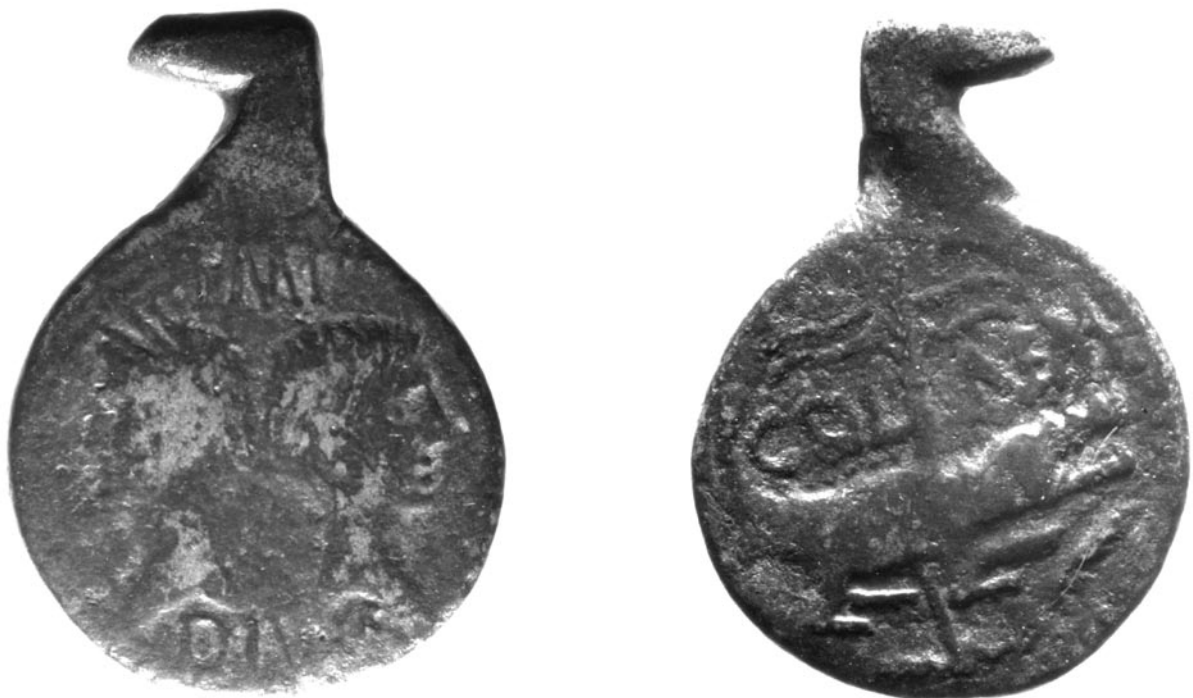
Fig. 3: Monnaie de Nîmes dite «à la patte de sanglier». Ces pièces sont généralement interprétées comme des ex-voto, des talismans ou des substituts d'offrandes animales.