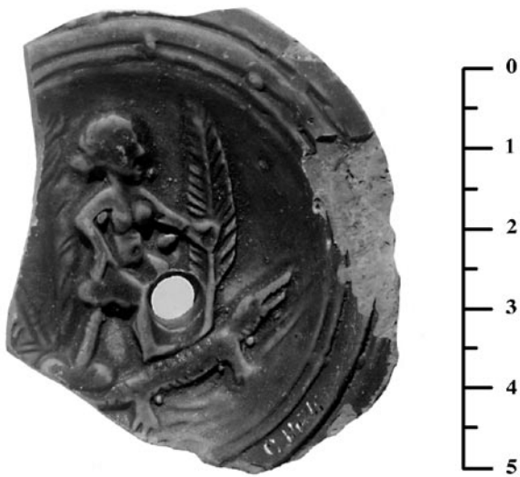
Fig. 1: Lampe à huile fragmentaire, trouvée à Genève (MAH inv. C 1474, Maison Broillet). Caricature obscène de la défaite de CLÉOPÂTRE à Actium. Le crocodile symbolise l'Égypte. La reine vaincue, tient, par dérision, la palme de la victoire (Photographie du Musée d'Art et d'Histoire de Genève).

tament (EZECHIEL : 29, 3 : « ... j'en veux à toi, Pharaon, roi d'Égypte, grand crocodile qui te tiens couché au milieu de tes fleuves... je te mettrai des crochets aux mâchoires... »), figure à ce titre sur certaines monnaies romaines ; seul dans le champ, il orne ainsi le revers d' aurei portant la légende ÆGYPTO CAPTA , frappés en 27 av. J.-C., peu avant qu'OCTAVE, sous son 7 e consulat, reçoive le titre d'AUGUSTE par le Sénat (MATTINGLY & SYDENHAM, 1923 : 21). Parmi les faveurs insignes octroyées à la colonie de Nîmes par AUGUSTE, (les motifs d'un telle générosité prêtent toujours à discussion : VEYRAC, 1998 : 50-62), figure le privilège de frapper, probablement entre 18 av. J.-C. et 14-15 de notre ère, des dupondii à l'effigie du crocodile (Fig. 2). Constituant trois séries, ces pièces au service de la propagande impériale, ont circulé en grand nombre dans l'Empire, particulièrement en Occident. L'avers présente les bustes adossés d'AUGUSTE et d'AGRIPPA, avec la titulature IMP(erator) DIVI F(ilius) , conférée par le Sénat à OCTAVE en 27 av. J.-C., et, sur certaines séries, le titre P(ater) P(atriae) , accordé à AUGUSTE en 2 av. J.-C. ; le revers figure un crocodile, l'Égypte, la queue dressée, enchaîné à une palme couronnée, symbole de la victoire, accompagné de la légende COL(onia) NEM(ausus) . Ce monnayage, qui célèbre la victoire navale d'Actium (le